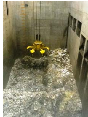
ダイナミックなクレーン